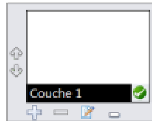
Outil calque ouvert